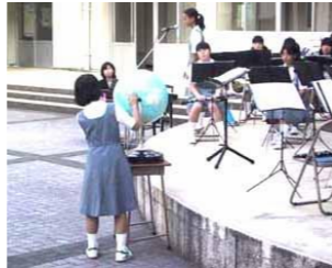
地球儀に飛行機のマーカーで、『夕暮れ号』は今ここ…

披露してくれました。工夫した演出、音楽でつなごう世界の架け橋…。飛行機『夕暮れ号』で、アジア・アフリカ・ヨーロッパ・南米・日本と世界の国々の音楽を案内してもらいました。会場には生徒の父母や学校近隣住民の方々が大勢つめかけ、見事な演奏に聞き惚れ、時折吹く夕暮れの涼しい風を受け、身も心も安らぎました。