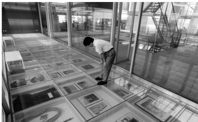
広報ひろしま「市民と市政」平成14年7月15日号より